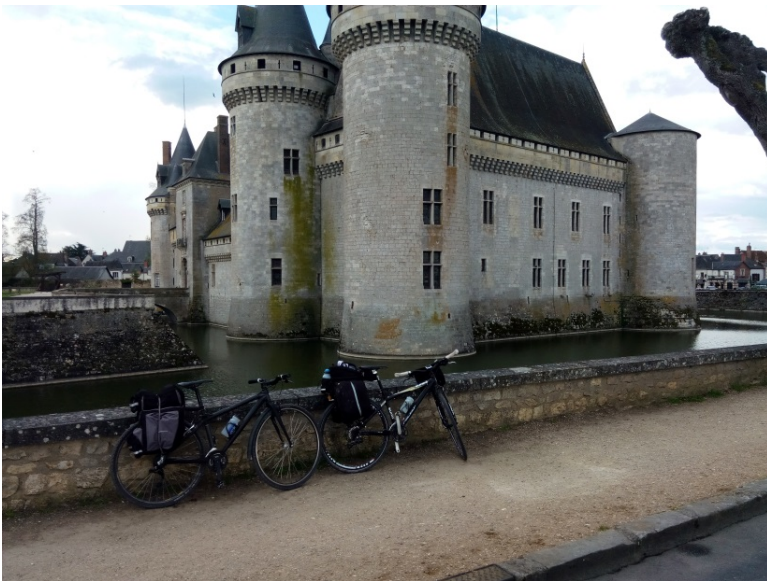
Le château de Sully-sur-Loire