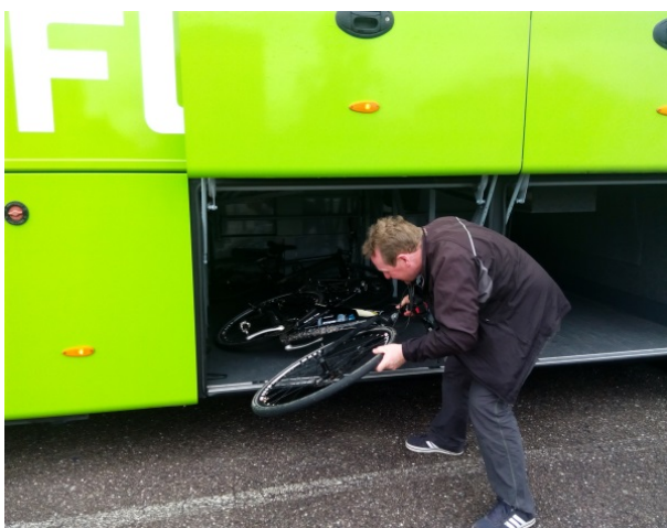
Les vélos dans les soutes du bus à l'arrivée