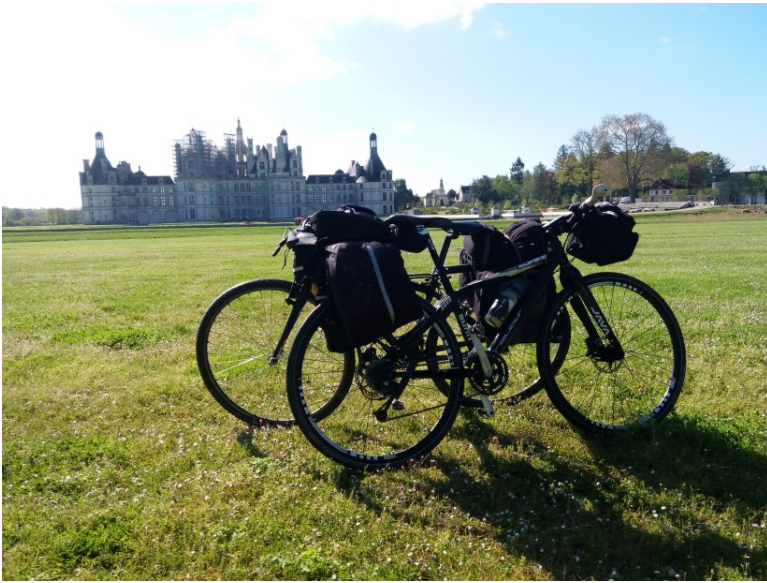
Le château de Chambord